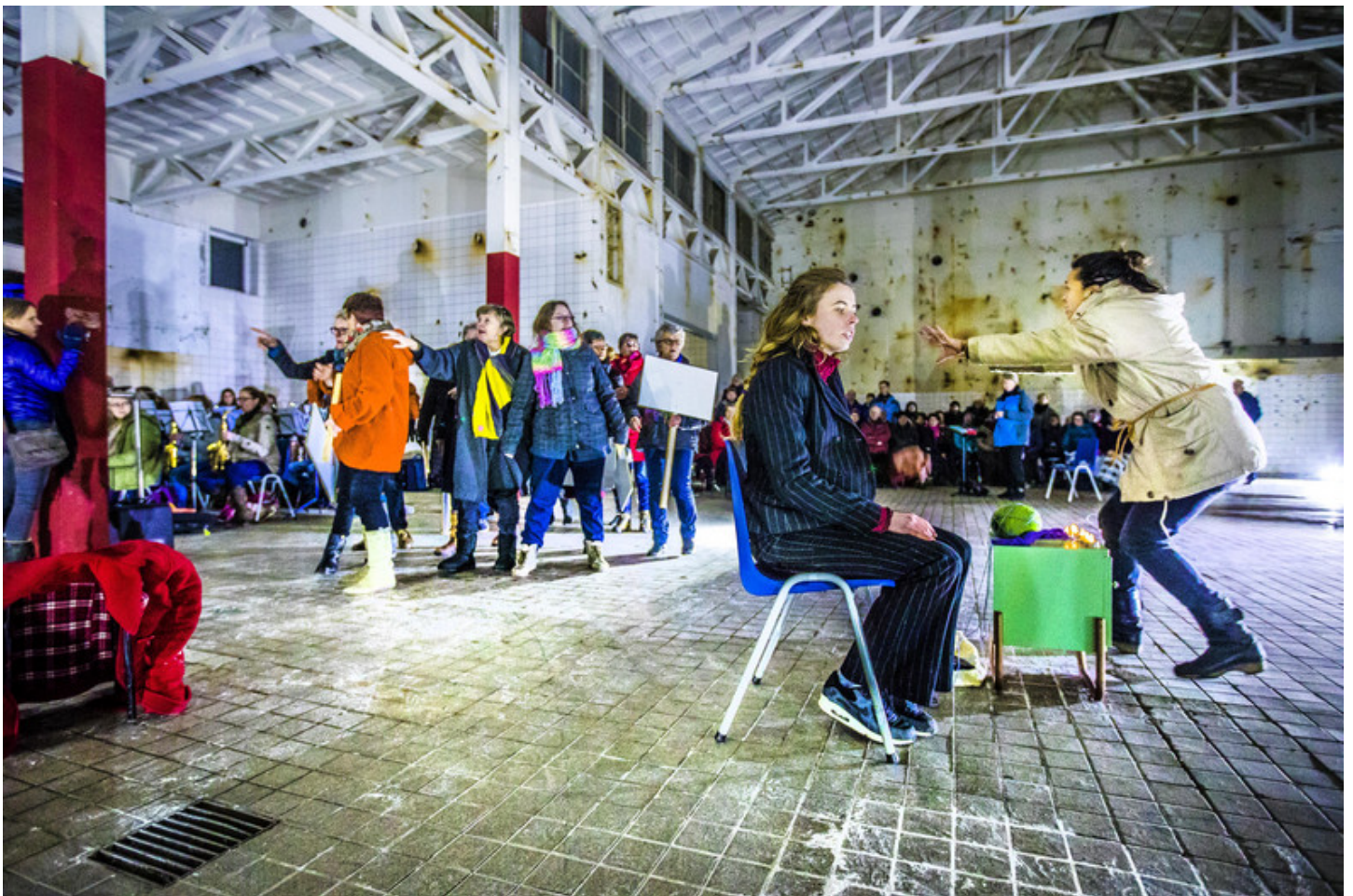
Oefenen voor de voorstelling in de oude Zwitsal-fabriek. De meeste acteurs en muzikanten droegen warme jassen tegen de kou.

De prateurvoorstellingen komen uit de koker van theatergezelschap De Plaats, dat eerder in Arnhem , Doesburg , Nijmegen en Wageningen voorstellingen liet zien. Van 11 tot en met 21 april 2018 speelt Muziektheater De Plaats het stuk 'Van Zwitsal naar CODA Prateur Apeldoorn', kaarten te zijn te koop via prateurapeldoorn.nl .